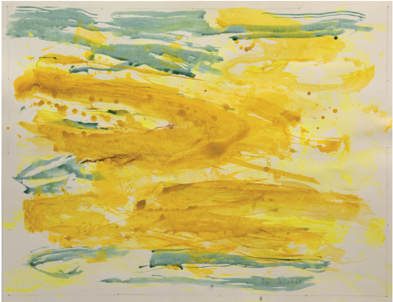
Auen 2021 Acryl, Öl auf Karton, 50 x 65 cm