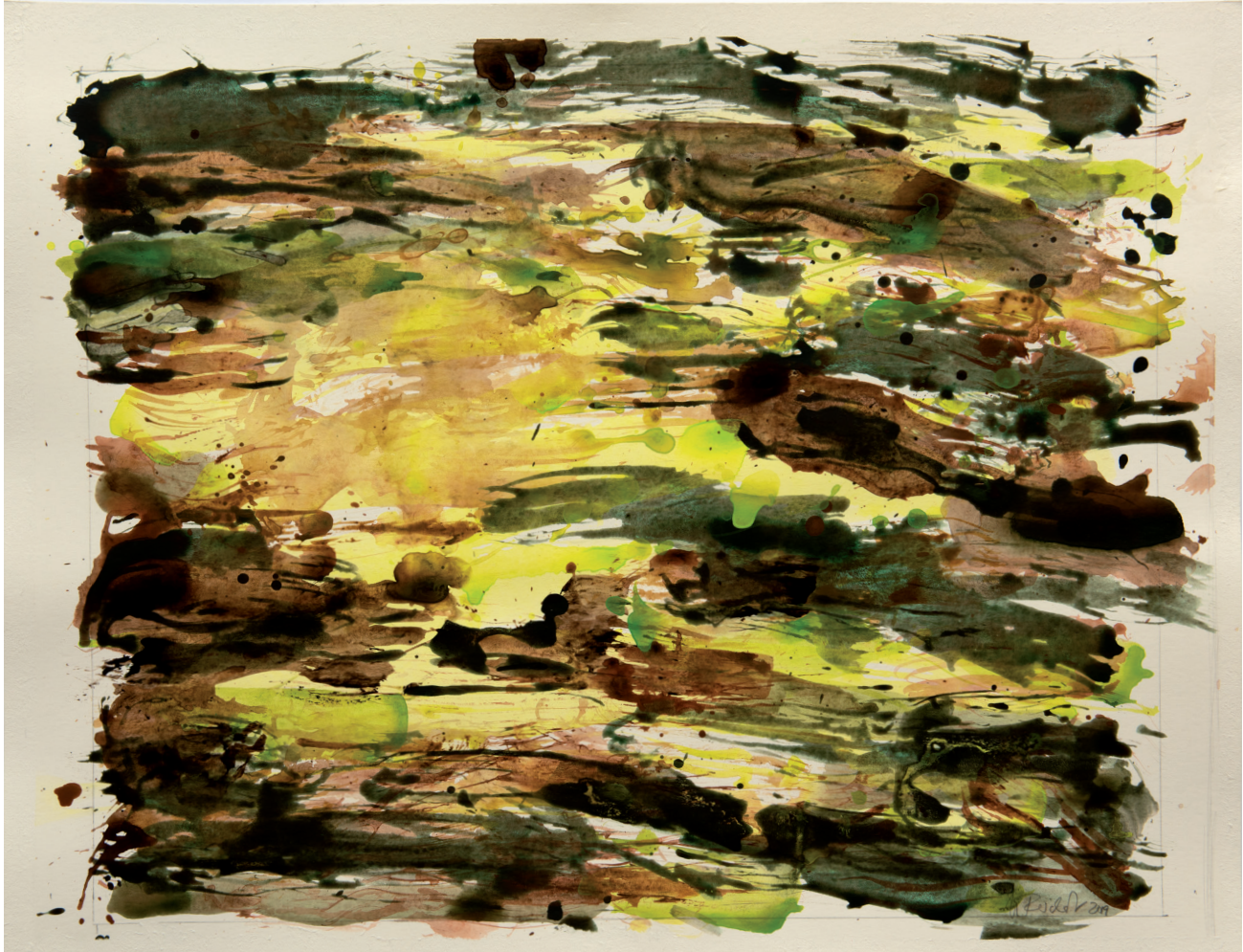
Auen 2020 Acryl, Öl auf Karton, 50 x 65 cm