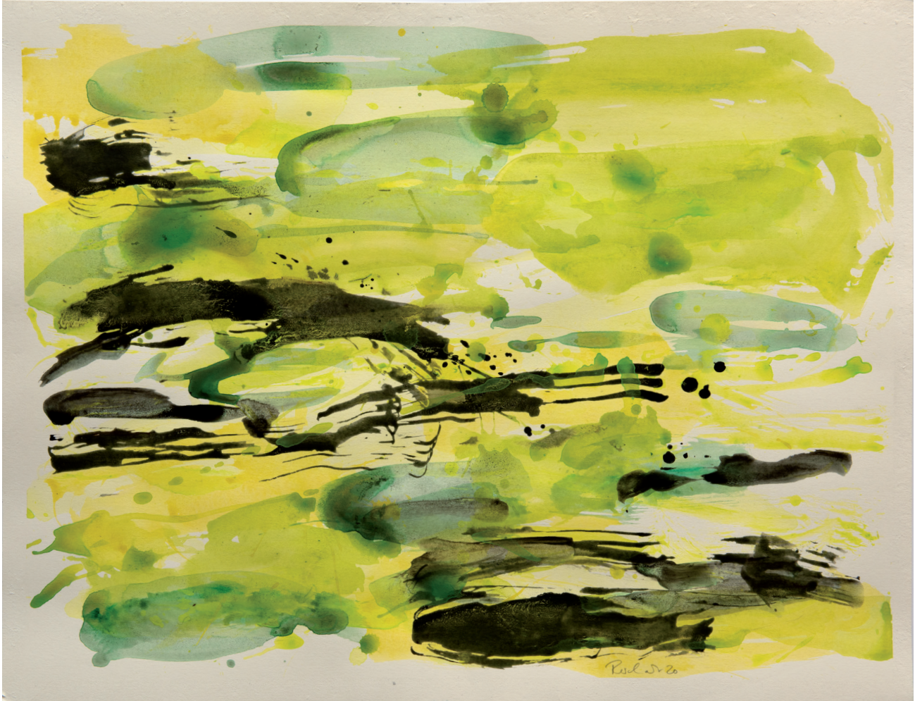
Auen 2020 Acryl, Öl auf Karton, 50 x 65 cm