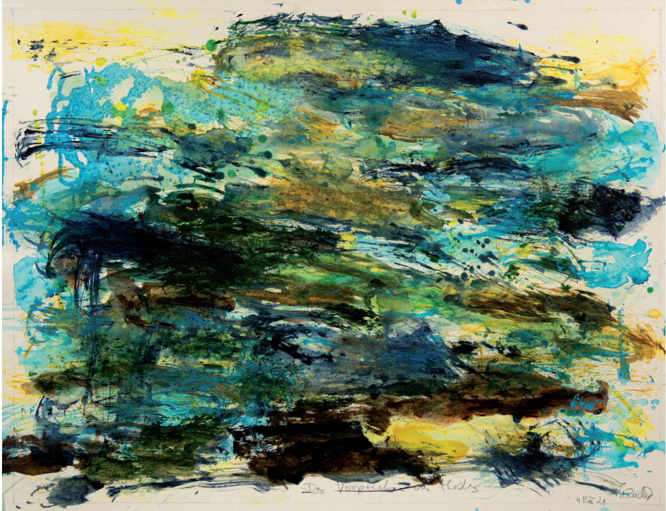
Auen 2021 Acryl, Öl auf Karton, 50 x 65 cm