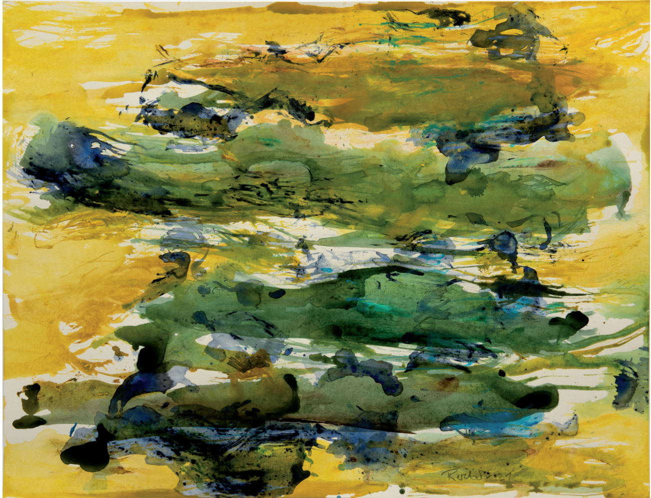
Auen 2021 Acryl, Öl auf Karton, 50 x 65 cm