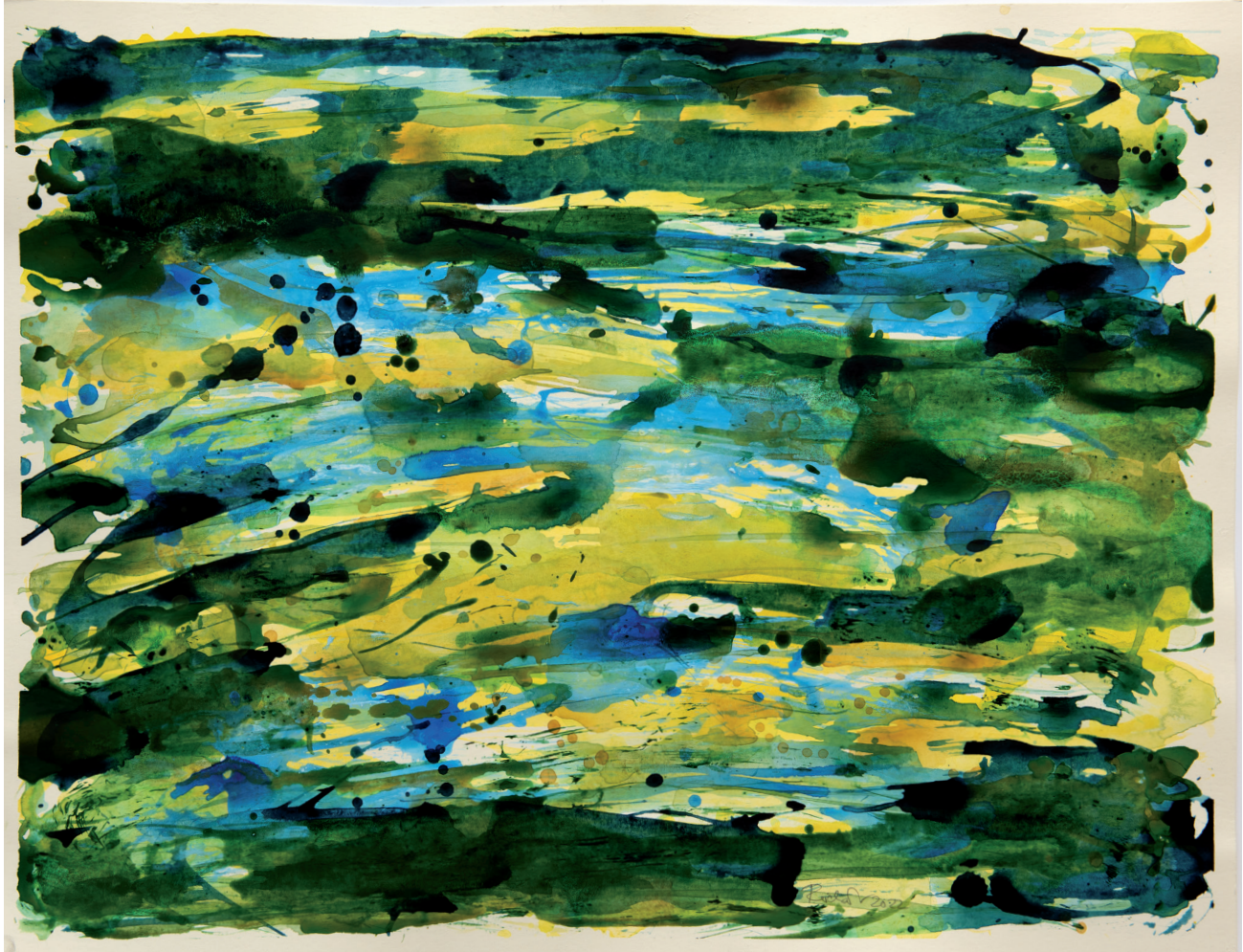
Auen 2021 Acryl, Öl auf Karton, 50 x 65 cm