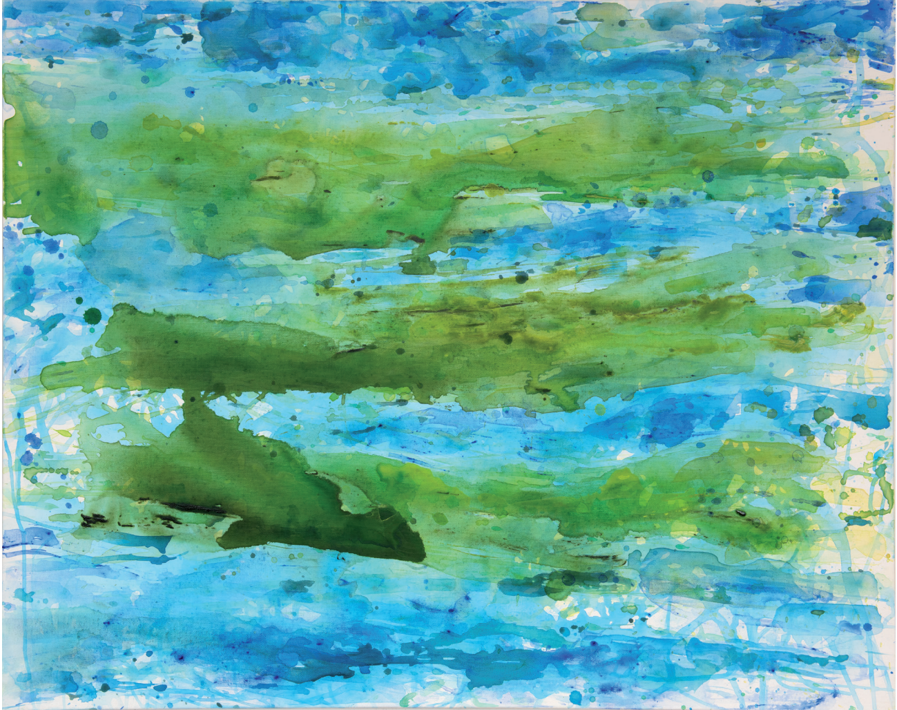
Auen 2020 Gouache, Acryl, Öl auf Leinwand 80 x 100 cm