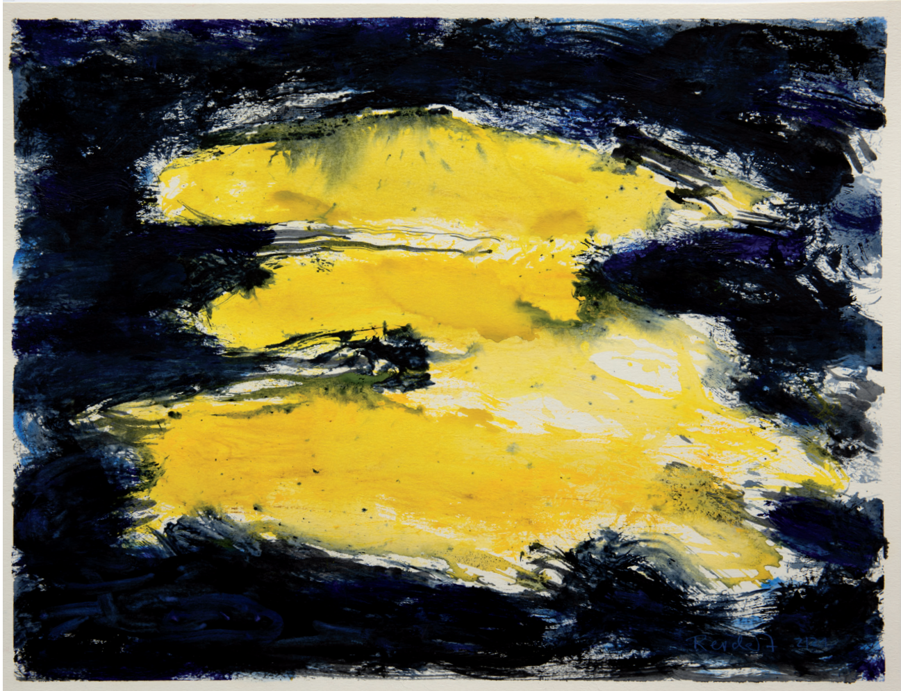
Auen 2021 Acryl, Öl auf Karton, 50 x 65 cm